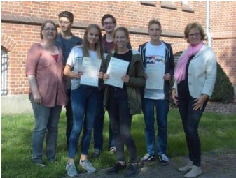
Verleihung der Cambridge-Zertifikate