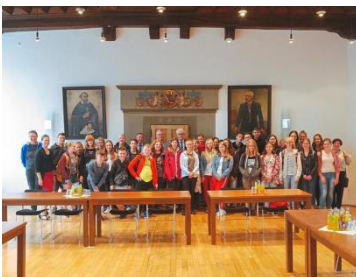
Austauschschüler aus dem polnischen Nysa