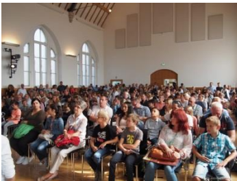
Begrüßung der neuen 5er in der Aula