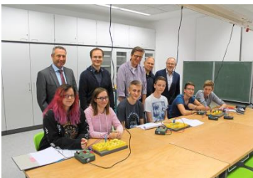
Neue Physikräume

Sehr geehrte Eltern, liebe Schülerinnen und Schüler, liebe Kolleginnen und Kollegen,